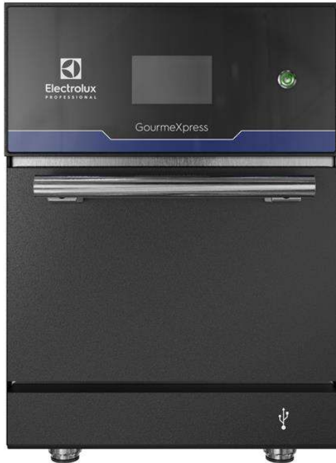
603952 (EPRPROBTD) GourmeXpress Hochgeschwindigkeits-Ofen mit zwei Magnetronen 380-415V/3N/50Hz